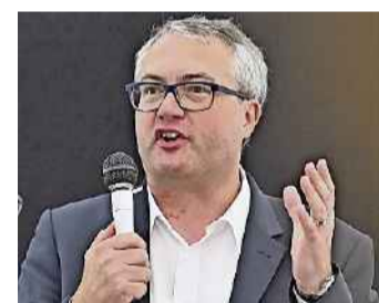
Remo Ankli Regierungsrat

«Gute Architektur geht haushälterisch mit dem Boden um.»