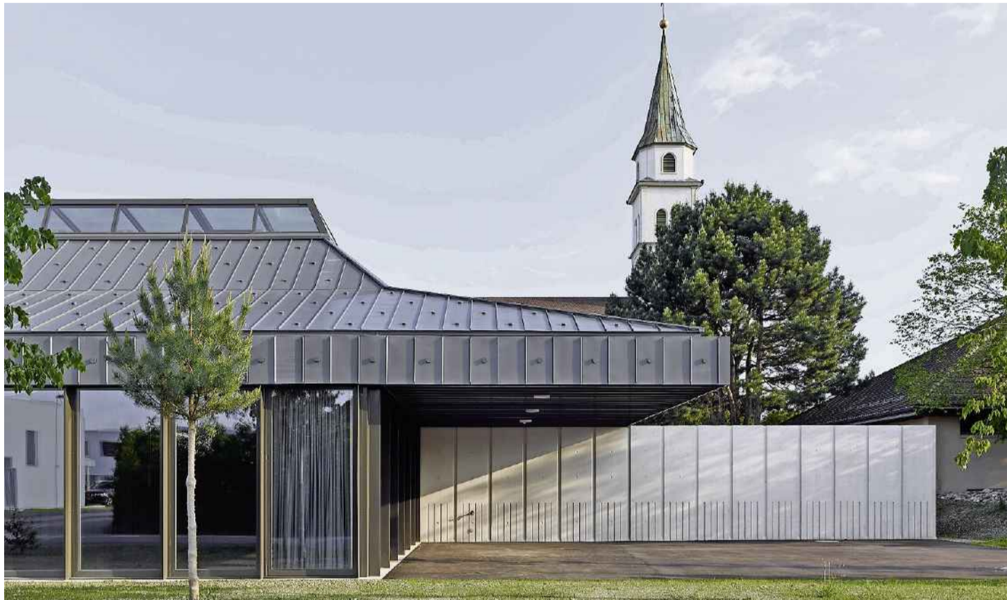
Das neue Pfarreizentrum Kriegstetten-Gerlafingen der Kirchengemeinde wurde mit einem «Priisnagel» 2019 ausgezeichnet, ebenso wie ...

Zwei Projekten wurde gestern Abend je ein «Priisnagel» zugesprochen: dem Umbau und der Innensanierung des Museums Altes Zeughaus in Solothurn durch Edelmann Krell Architekten Zürich. «Gestalterisch und konstruktiv überzeugend wurde das Alte Zeughaus den Anforderungen an einen zeitgemässen Museumsbetrieb angepasst. Die 400 Jahre alte Baukunst konnte so erhalten und für die Zukunft gesichert werden», lobte die